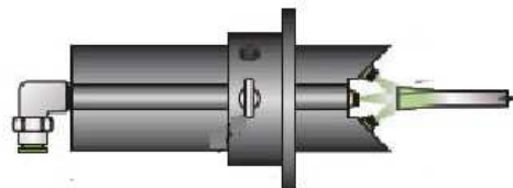
Buse spécifique 3 voies pour scie circulaire et ruban.

Ensemble complet miniaturisé comprenant :